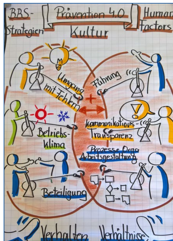
Abb. 2 erfolgreiche Prävention; Begriffserklärungen unter www.dguv.de - Webcode d162327