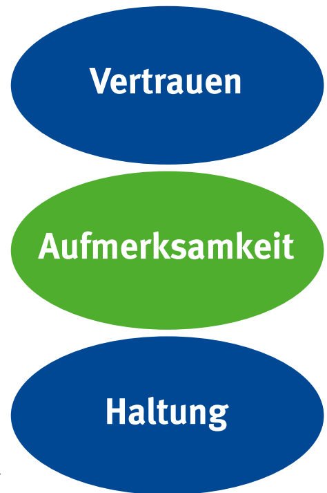
Abb. 4 gesunde und sichere Arbeitskultur

In der Psychologie geht man davon aus, dass sich Menschen 5-7 neue Informationen auf einmal merken können, z. B. die 5 Erfolgsgeheimnisse. Allerdings gehen im Alltagsgeschäft auf dem Weg zwischen Gedächtnis und Handlung auch 5-7 Informationen wieder verloren. Greifen Sie sich daher erst einmal nur eine oder zwei Ideen heraus, die Sie umsetzen oder ausprobieren wollen. Wenn Sie damit Erfahrungen gesammelt haben, können Sie sich an eine weitere Idee wagen und diese erproben. Um herauszufinden, womit Sie beginnen sollten, können Sie auch den "Kurz-Check Handlungsfelder" für sich bearbeiten, denn in einer gesunden Unternehmenskultur vertraut man sich untereinander, ist aufmerksam und vertritt eine sichere Haltung (vgl. Abb. 4).